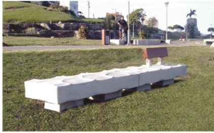
Banco modelo Mar