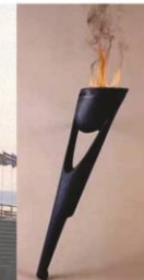
FOTOS 2 Objetos especiales para los XII Juegos Deportivos Panamericanos