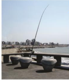
Banco modelo Plaza España