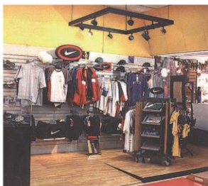
FOTO 4 POP para Nike, Topper, Converse, Rainha Brasil, etc