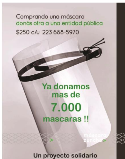
FOTOS 6 Uno de los posteos de las Mascara Zuncha.