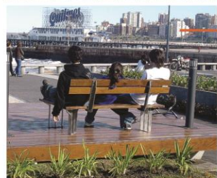
Bancos modelo Deck

bancos de madera y acero Version en ele o recto, gimnasio, taburete, etc