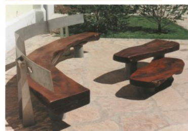
Bancos de la Plaza del agua, de madera de algarrobo y acero inoxidable

Decks urbanos intervención integral de la calle Güemes