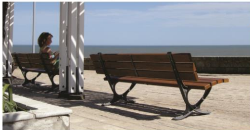
Banco modelo Plaza Colon

bancos de fundición gris y madera natural