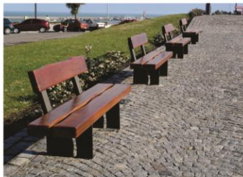
Banco modelo Parque Primavera